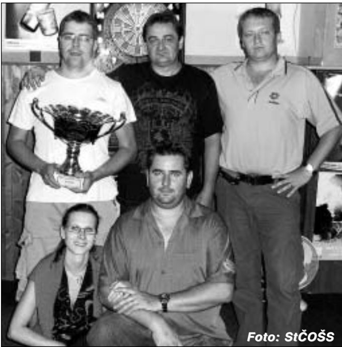
Vítězné družstvo Letní ligy - ŠK Pavon.